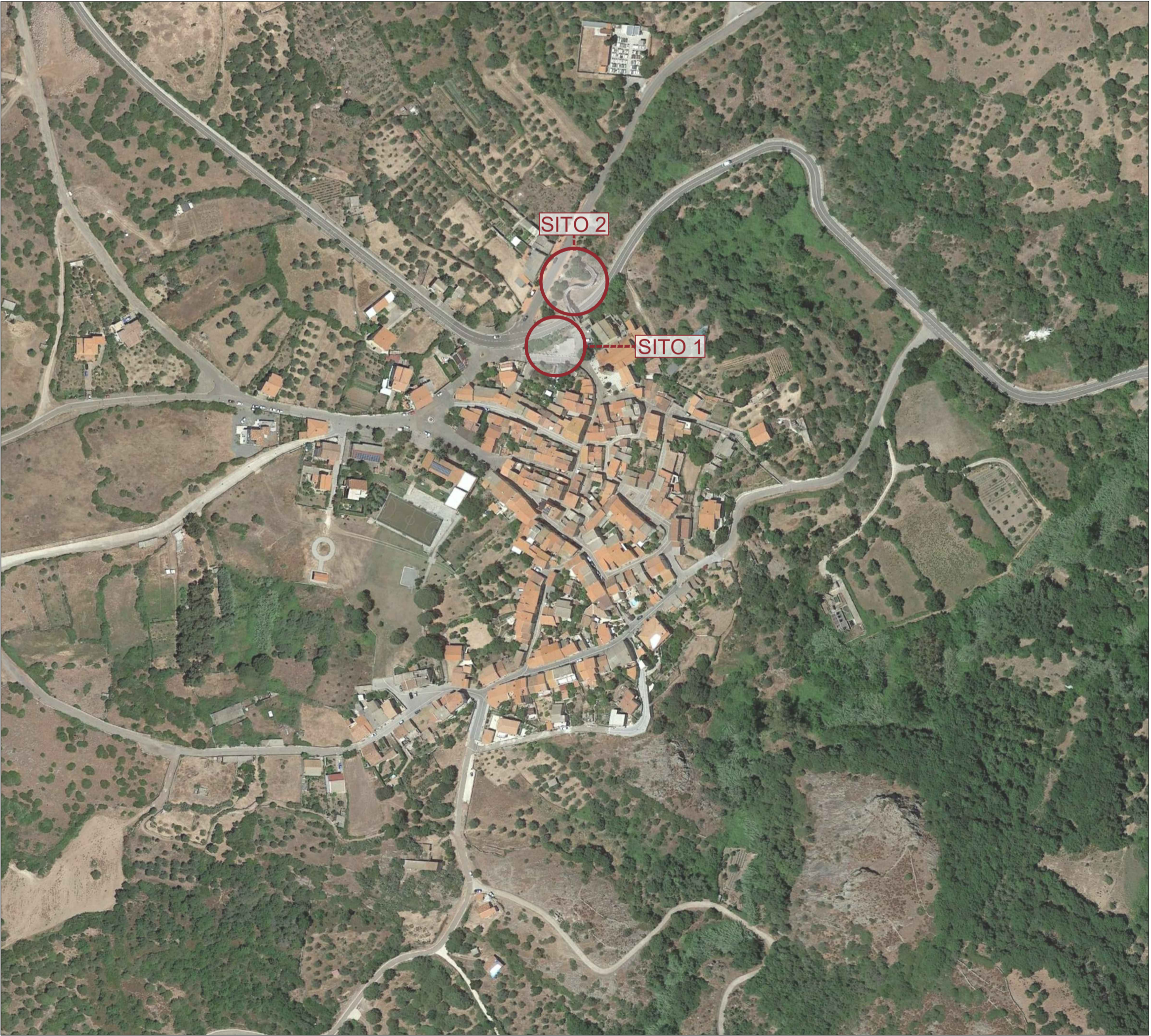
ORTOFOTO DI INQUADRAMENTO TERRITORIALE - SCALA 1:2.500